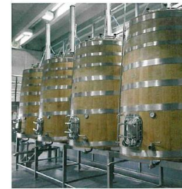
Wie in den besten Bordeaux-Weingütern: Zurück zu Holzlagertanks.

2007 Tesoro, 14%, K (MECS) Fein verwobene Duftstofffülle, ganz klar, zartes Cassis-Bräunelotter; wunderschöne elegante, feine, feste, dicke Frucht, bei aller Fülle auch sehr trinkfreundlich, ausgesprochen fein, hat Substanz für mindestens ein Jahrzehnt.