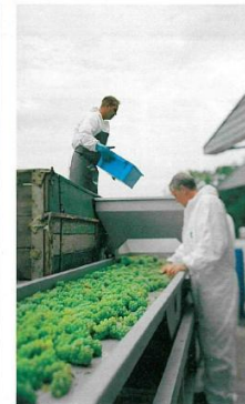
Peinlich genaue Kontrolle und Selektion bei der Traubenentleitung.