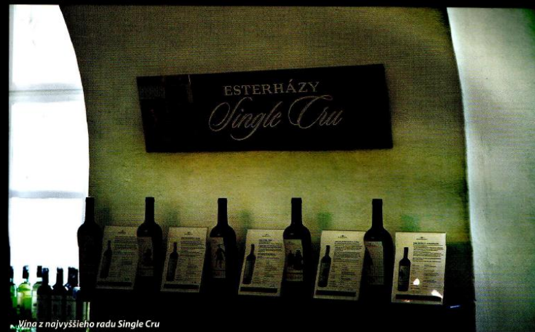
Vína z najvyššieho radu Single Cru